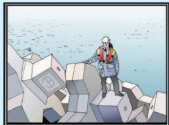
*X-bloc heten deze betonblokken die goed in elkaar grijpen, zuinig zijn met materiaal en de energie uit de golven weten te halen.

De eerste bekende golfbreker is rond 2000 voor Christus gebouwd om de haven van Pharos te